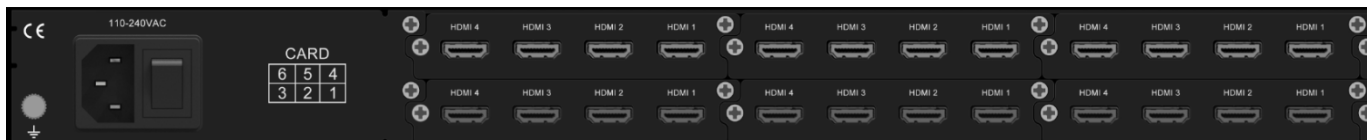
设备后面板单电源 HDMI 接口